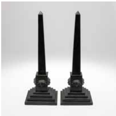
0362 Paar Obelisken 19. Jahrhundert.

Je Stein, geschwärzt. H. 47 cm. Kl. Bestn. (78679/0006)