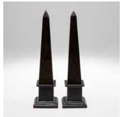
0366 Paar Obelisken Ende 19. Jahrhundert.

Metall, braun patiniert. H. ca 37 cm. Ein Obelisk zwei minim. Bestn.