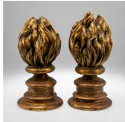
0365 Paar Dekorations-Flammen

Je Holz, geschnitzt; rot und goldfarben bemalt. H. 42 u. 44 cm. Altersspuren, Abplatzer. (78679/0014)