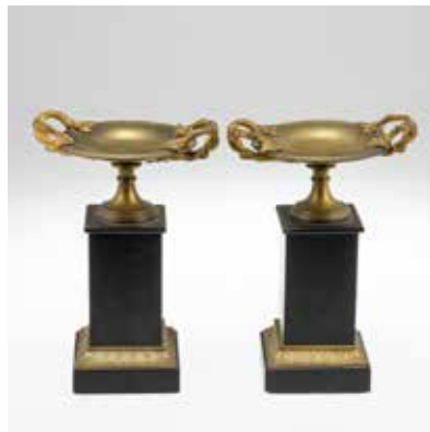
0364 Paar Empire Beisteller mit Tazza Frankreich, um 1850.

Marmor. Bronze. 25 x 17 x 13 cm. Best. (78679/0044)