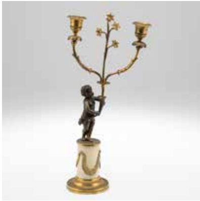
0361 Empire Kerzenleuchter Frankreich, um 1810.

Bronze. Marmor. H. 38 cm. B. 18 cm. Rest.bed. (78660/0007)